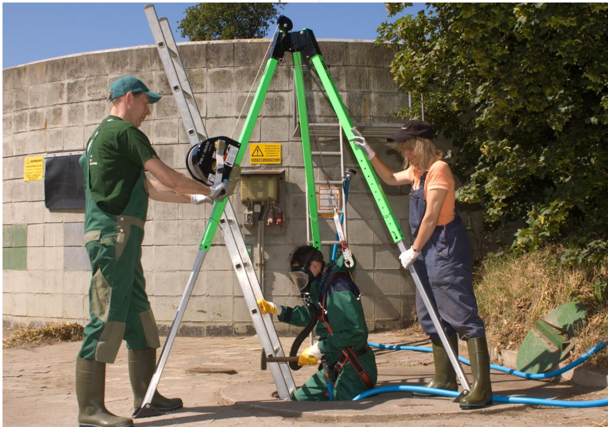
Einstieg ins Güllelager am Rettungsgurt mit einem umluftunabhängigen Frischluftgerät - gesichert durch zwei Personen.