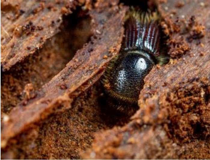
Buchdrucker Adulter Käfer