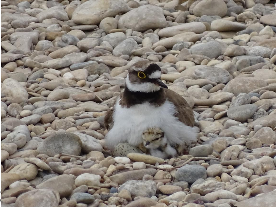
Flussregenpfeifer brüten direkt auf dem Kies

Die Weidetiere helfen, diesen Lebensraum für den Flussregenpfeifer zu erhalten. Die Anzahl der Weidetiere wird begrenzt, damit sie den Gelegen nicht zu nahekommen und die brütenden Altvögel nicht aufstören. Naturschützer und Schäfer achten in der Brutzeit auf die Gelege und zäunen sie – wo dies nötig scheint – aus.