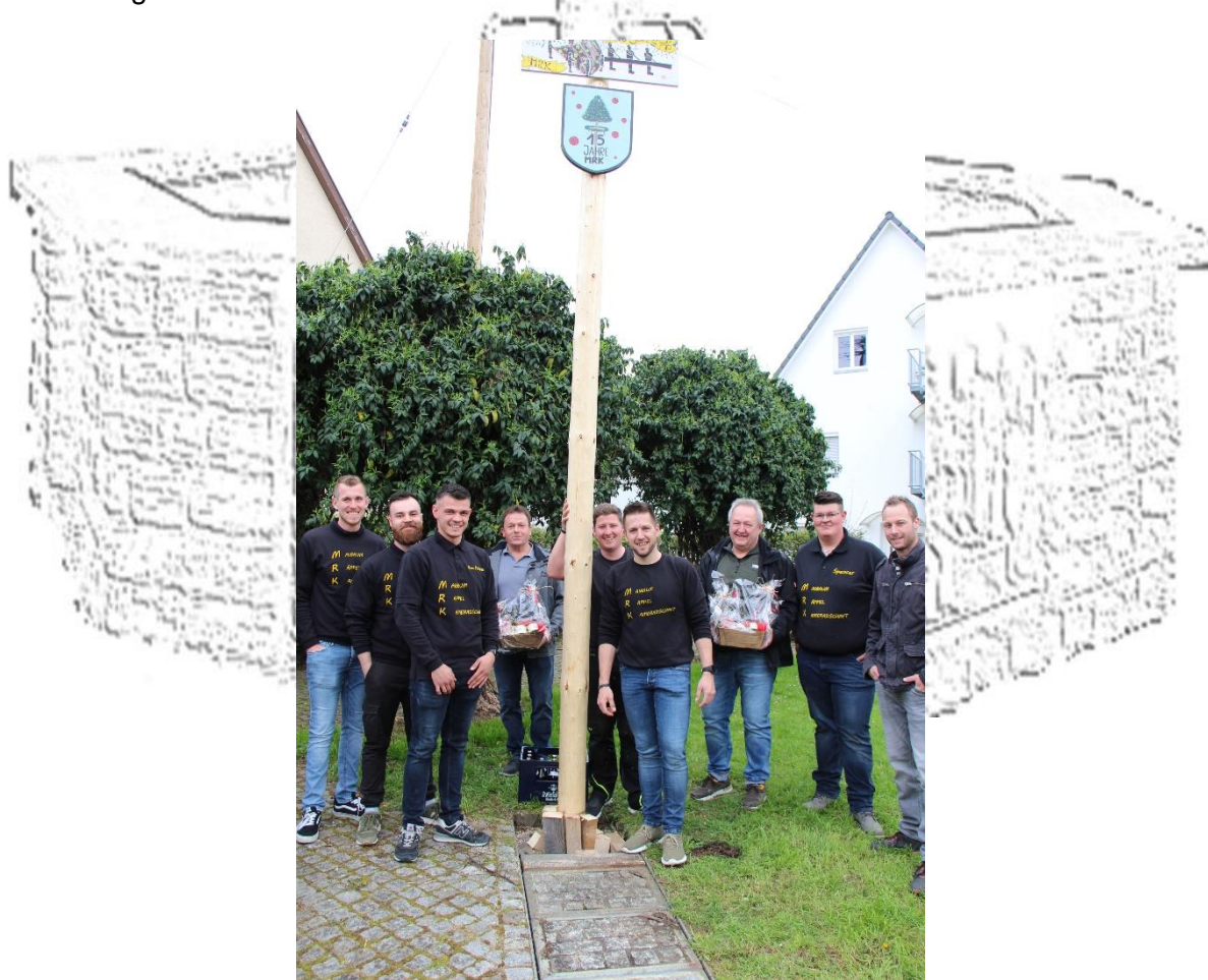
Die Rappelkameradschaft hatte Presente fur langjahrigere Unterstutzer uberreicht

Das Zelt auf dem Dorfplatz und die Garnituren um das Zelt waren den ganzen Abend voll gefullt. Es wurde mit Speis und Trank bewirtet. Es gab Steak, Rote Wurst und Waffeln. Die Bewohner von Grosselfingen kamen zahlreich und auch am Weizenbierstand und an der Sektbar herrschte Hochbetrieb. Bis spat in die Nacht gab es Hochstimmung in der Grosselfinger Dorfmitte.