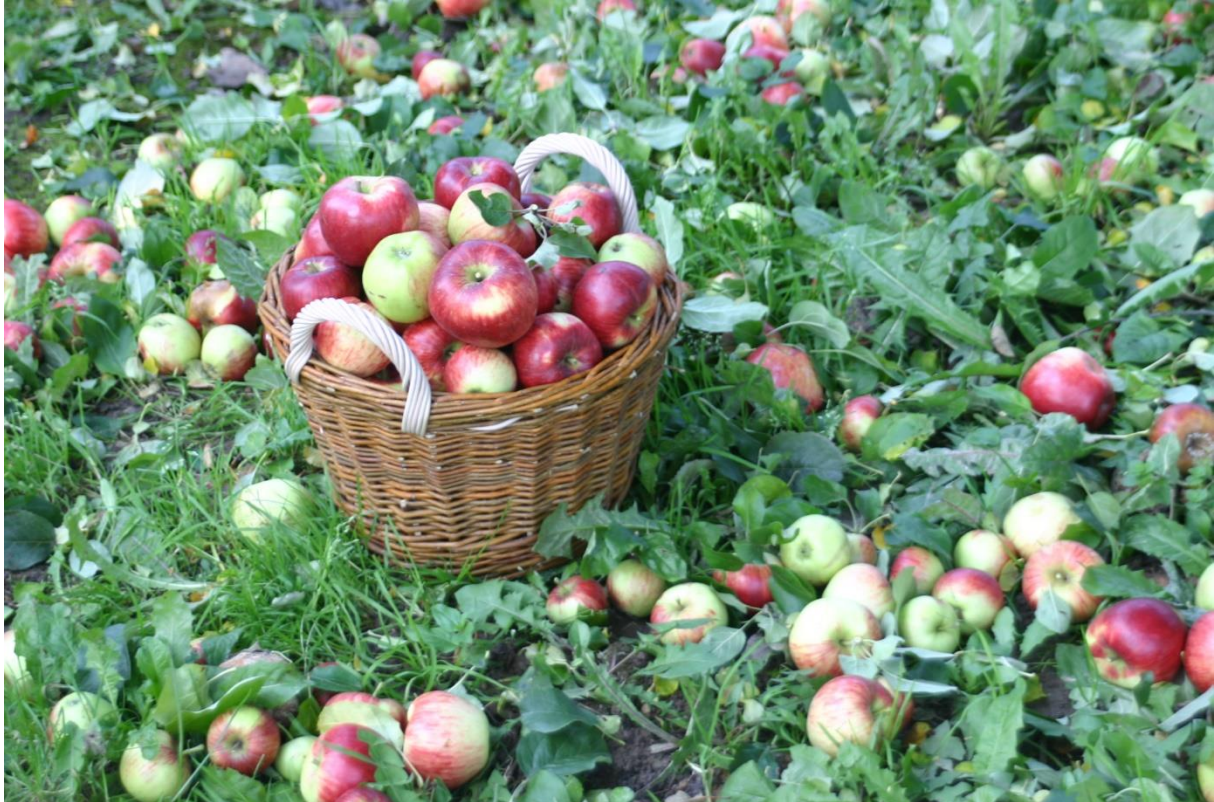
Titelvorschlag: Über 2.000 verschiedene Obstsorten gibt es auf den schwäbischen Streuobstwiesen. Einen ersten Einstieg in das weite Feld der Pomologie liefern die Seminare des Vereins Schwäbisches Streuobstparadies.