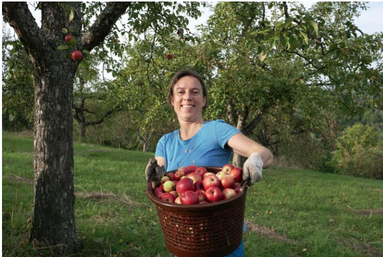
Foto: Geschmackliche Vielfalt: Tafeläpfel von der Streuobstwiese.

Schwäbisches Streuobstparadies Bismarckstrasse 21, 72574 Bad Urach Tel. 07125 309 3262 handelsplattform@streuobstparadies.de www.streuobstparadies.de www.handelsplattform-streuobst.de