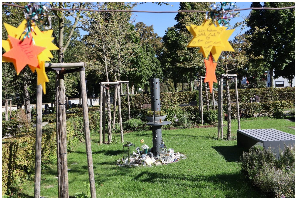
Das Grabfeld für die Sternenkinder auf dem Friedhof in Balingen.

Das Zollernalb Klinikum gGmbH informiert.